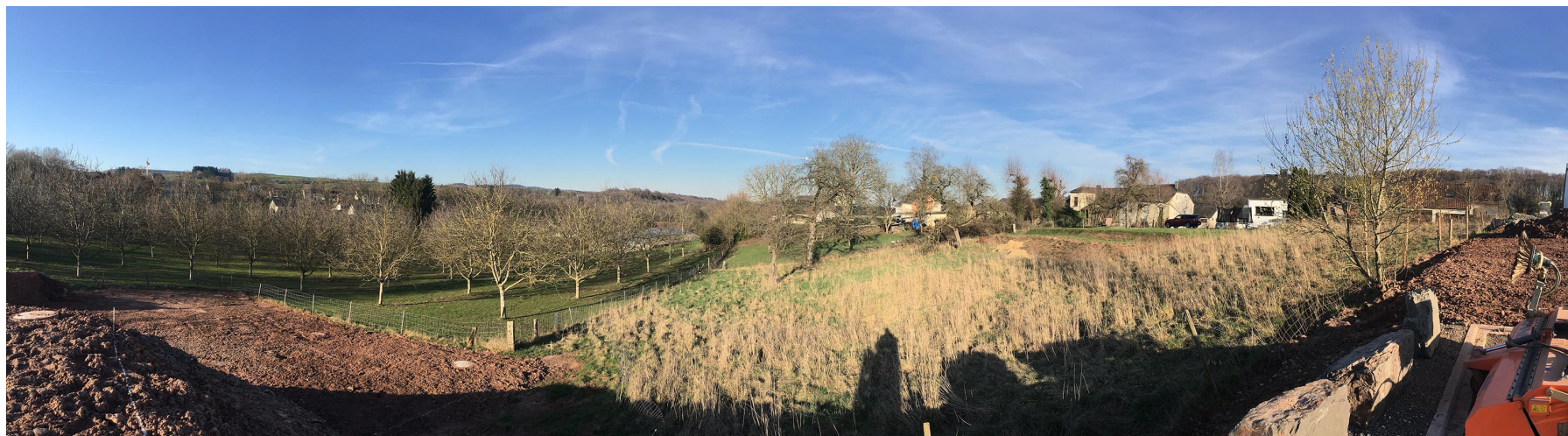
Illustration 4 : photo du site, vue depuis le nouveau lotissement près du cimetière