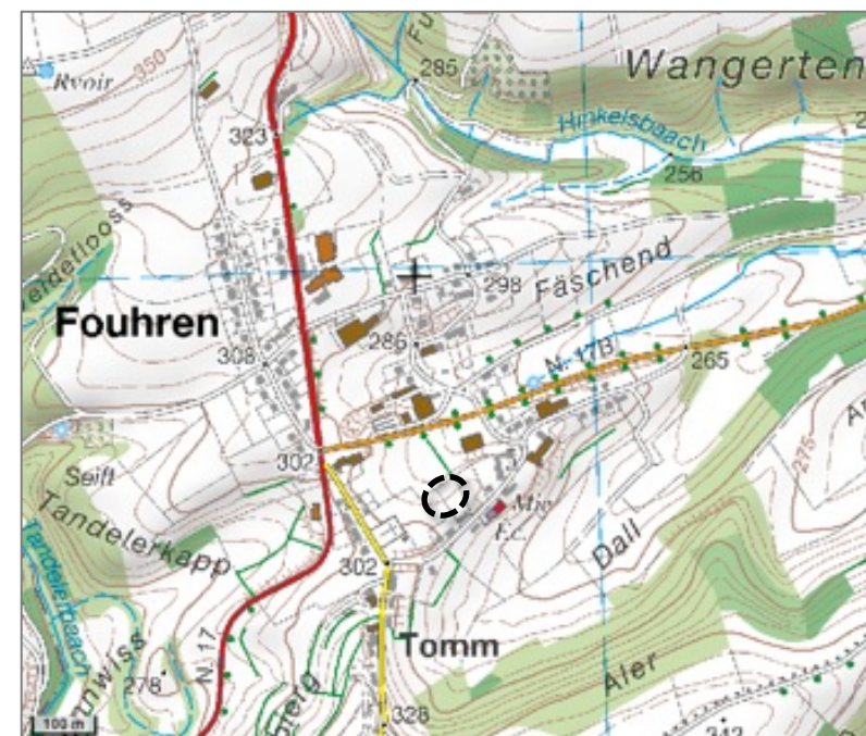
Illustration 1 : plan de situation (base : carte topographique ACT)