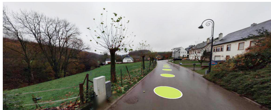
Vue du site depuis l'extrême Est rue Um Sand