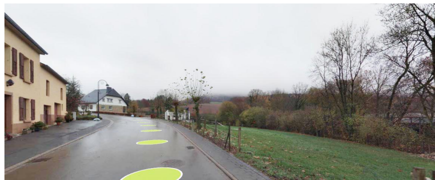
Vue du site depuis l'ouest rue Am Duerf