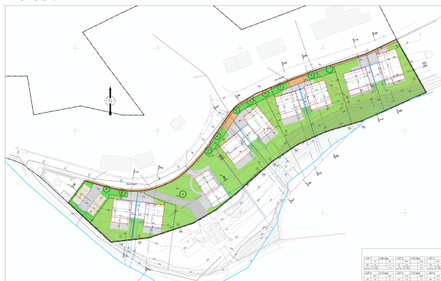
Illustration 3 : projet de PAP - version 22 octobre 2019

L'esquisse constitue un exemple et est renseignée uniquement à titre indicatif.