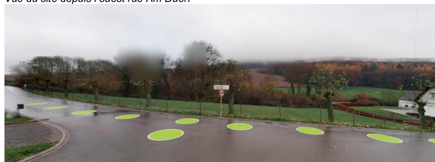
Vue du site depuis le milieu au carrefour avec la rue Marxbiert