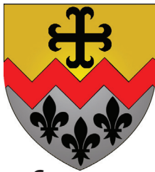
Commune de Bettendorf